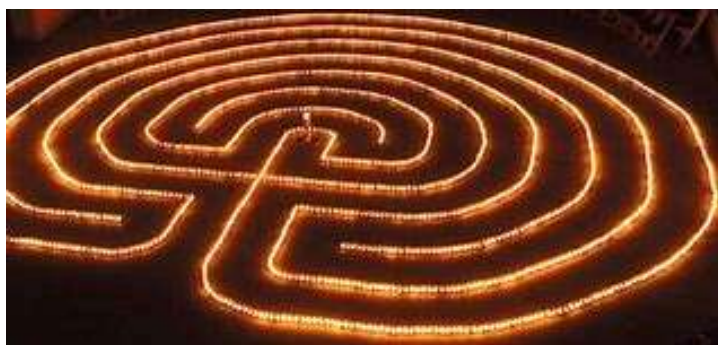
Adventlabyrinth van de Drumlog Chuck, Schotland

Het maken van een advent labyrinth van kaarsen is een gebruik dat ook al oud is.